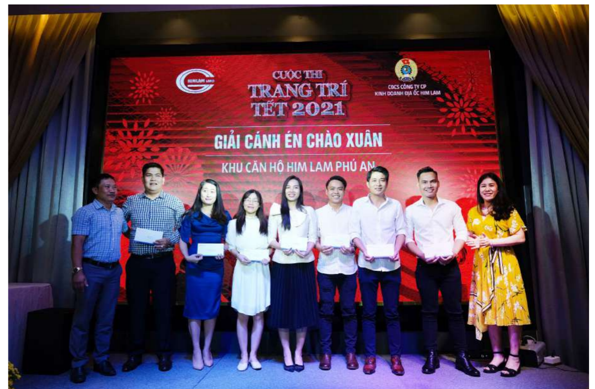
7 phòng ban “vàng” đã được vinh danh tại cuộc thi “Trang trí Tết văn phòng 2021”

Theo đó, 7 phòng ban “vàng” đã được vinh danh tại cuộc thi “Trang trí Tết văn phòng 2021” với các hạng mục giải thưởng cụ thể như sau: Giải “Hương sắc mùa xuân” thuộc về Phòng Đầu Tư; Giải “Rộn ràng đón xuân” thuộc về phòng Dịch vụ chăm sóc khách hàng và khu căn hộ Riverside; Giải “Cánh én chào xuân” thuộc về Phòng Tiếp thị và Truyền thông và Khu căn hộ - Him Lam Phú An; Giải “Lộc Xuân đông đầy” thuộc về Phòng Tổng Hợp và Phòng Dự án.