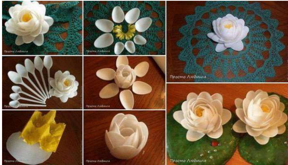
Hoa sen từ thìa nhựa trang trí Tết được làm khá đơn giản.

Nhiều người quan niệm rằng trang trí Tết handmade bằng lồng đèn có ý nghĩa mang đến sự may mắn, ấm cúng và đoàn tụ của gia đình. Cách làm đèn lồng cho ngôi nhà thêm lung linh vào ngày Tết cũng rất đơn giản. Chỉ cần những tờ giấy với nhiều màu sắc, băng keo và một số đồ dùng khác là có thể hoàn thành được chiếc đèn lồng rực rỡ đón Tết 2021.