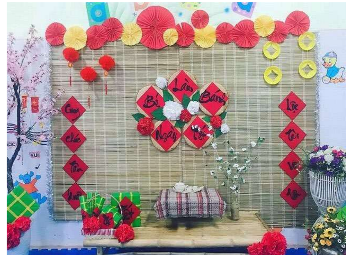
Trang trí cửa lớp mầm non ngày Tết hấp dẫn, ấn tượng cũng là một điểm nhấn để thu hút các bé.

Bên cạnh đó nhiều trường mầm non cũng lựa chọn trang trí Tết bằng tiểu cảnh phiên chợ quê ngày Tết. Trang trí tiểu cảnh phiên chợ quê ngày Tết sẽ khiến các bé vô cùng thích thú khi được hóa thân, và trải nghiệm thực tế, trở thành những người buôn bán phiên bản nhí vô cùng dễ thương ở chợ quê, hay những ông đồ già cho chữ với tạo hình ngộ nghĩnh.