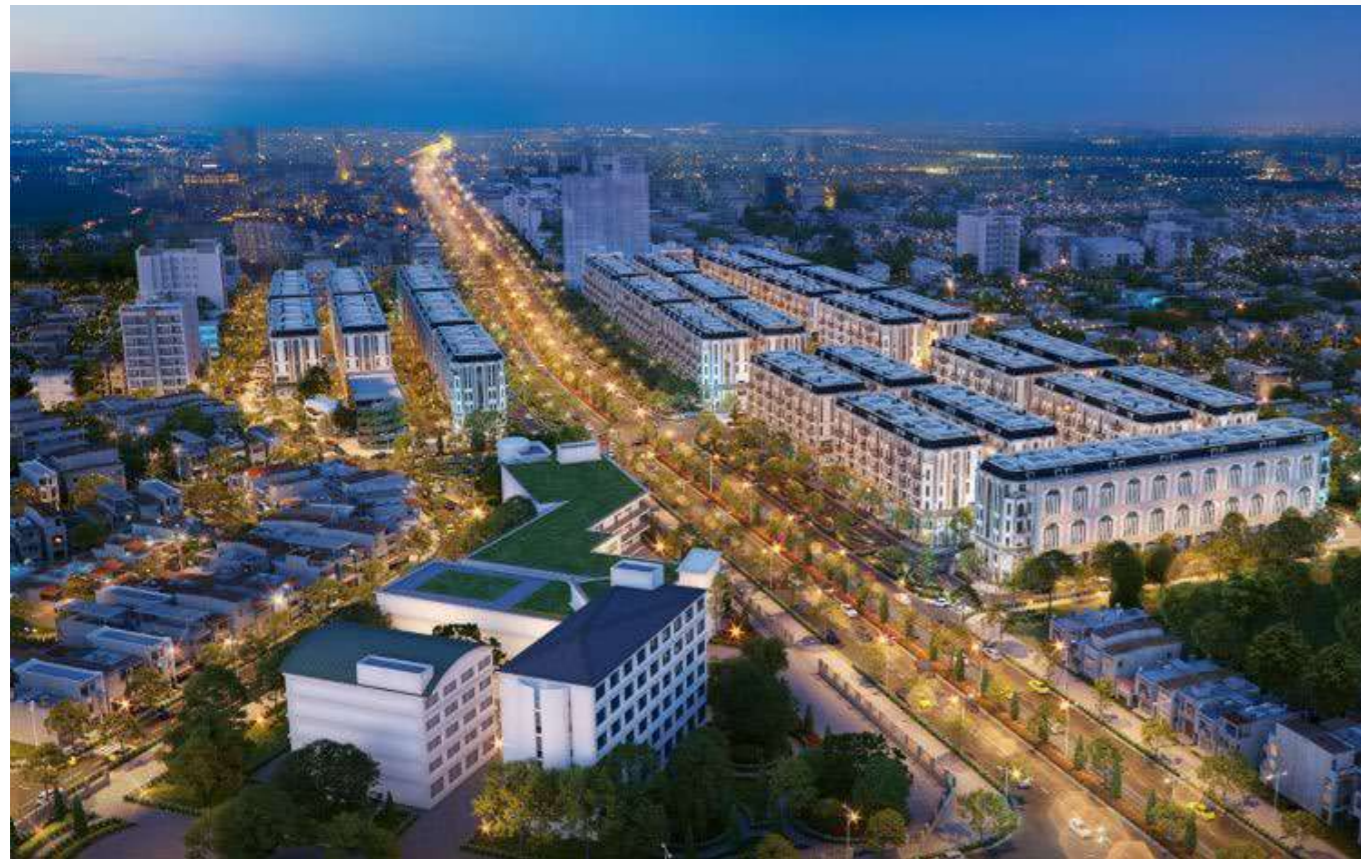
Shophouse 2 mặt tiền Him Lam Vạn Phúc

Thị trường bất động sản đang có dấu hiệu phục hồi rõ nét thông qua hàng loạt các dự án lớn được bung hàng.