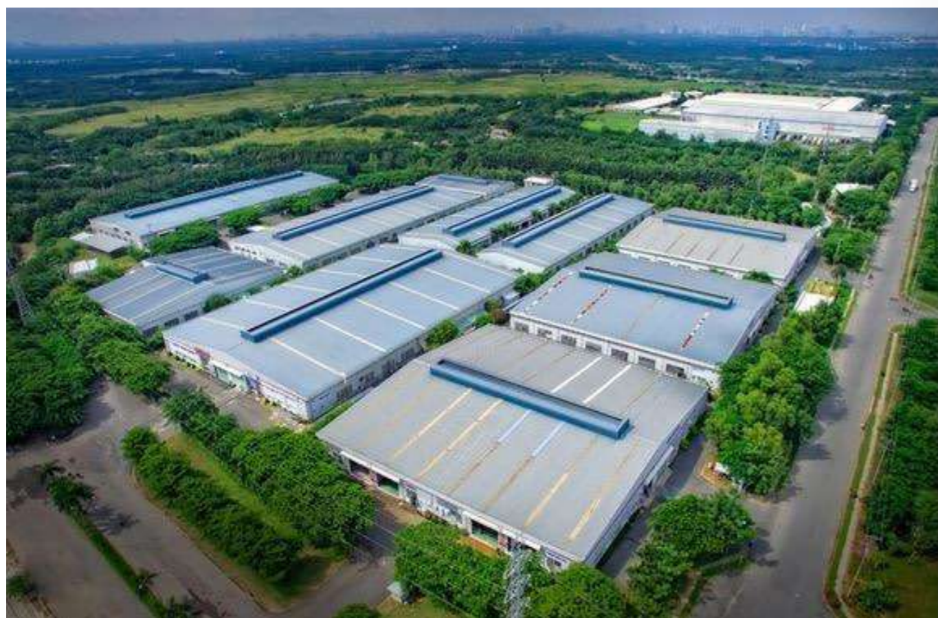
Bất động sản công nghiệp được dự báo sẽ bứt phá mạnh trong năm 2021.

Theo nhận định của các chuyên gia, dưới tác động mạnh mẽ của hạ tầng cùng làn sóng chuyển dịch nhà máy khỏi Trung Quốc sẽ đẩy mạnh thị trường bất động sản (BDS) công nghiệp tại các tỉnh lên ngôi trong năm 2021.