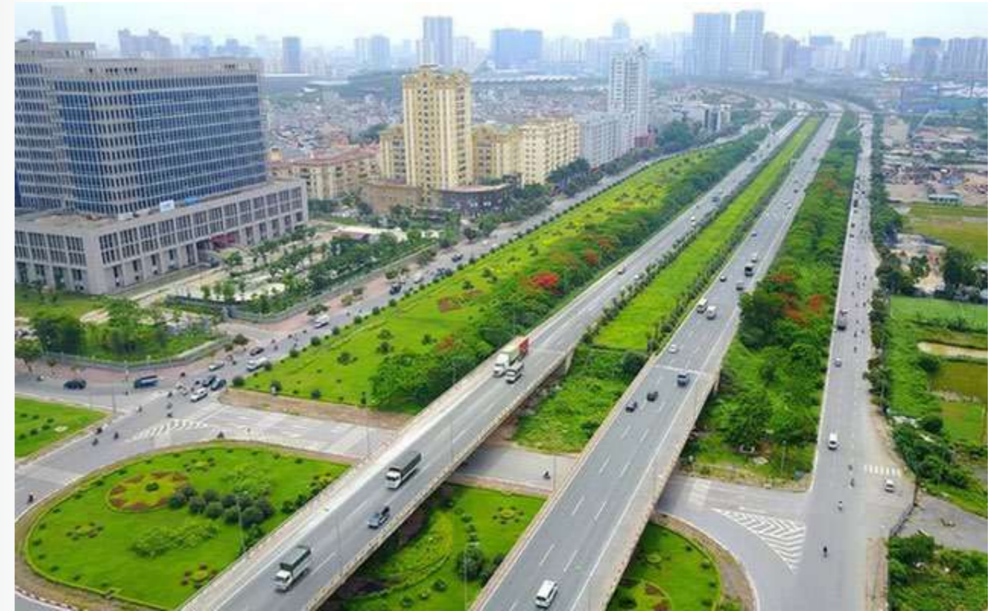
Bất động sản và chứng khoán có mối quan hệ khăng khít.