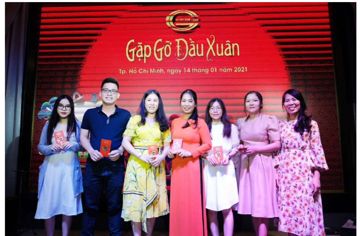
Buổi tiệc diễn ra trong không gian ấm cúng, sum vầy.

Tại buổi lễ, Công đoàn Cơ sở Công ty Him Lam Land đã trao những phần quà ý nghĩa cho các CBCNV có hoàn cảnh khó khăn. “Xuân nhân ái - Tết yêu thương” là một thông điệp ý nghĩa mà Công đoàn cơ sở Him Lam Land năm nay mong muốn được gửi đến toàn thể anh/chị/em CBCNV Him Lam Land. Thông qua những phần quà trên, Công đoàn Cơ sở Công ty Him Lam Land mong muốn sẽ phần nào san sẻ được những khó khăn để các anh/chị/em có thể đón Xuân Tân Sửu đầm ấm, trọn vẹn bên gia đình.