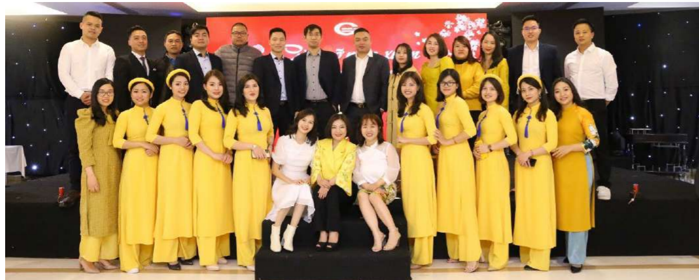
Tập thể cán bộ nhân viên Chi nhánh Hà Nội Công ty Him Lam Land tề tựu đông đủ tại buổi tiệc