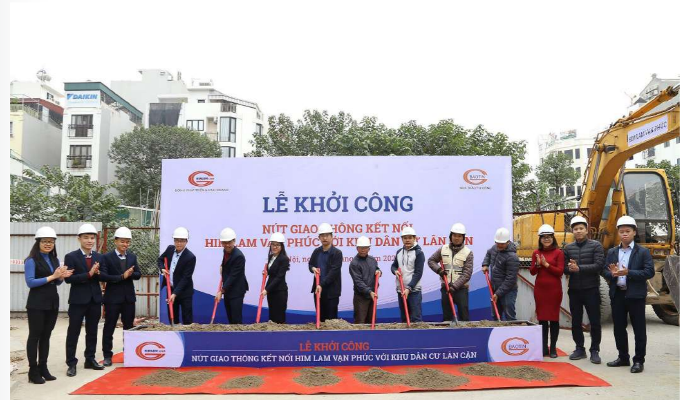
Lễ khởi công nút giao thông kết nối Him Lam Vạn Phúc với khu dân cư lân cận diễn ra vào ngày sáng 9/1

Lễ khởi công có ý nghĩa vô cùng quan trọng khi góp phần hoàn thiện hạ tầng giao thông trong nội – ngoại khu cũng như thuận tiện cho việc giao thương buôn bán bởi lưu lượng người qua lại tăng cao khi tuyến đường được kết nối. Đặc biệt, với thiết kế 6 tầng, 2 mặt tiền, đồng thời tọa lạc tại vị trí trung tâm kết nối giao thông, Him Lam Vạn Phúc mang lại lợi ích “kép” phù hợp cả nhu cầu kinh doanh – đầu tư cũng như an cư.