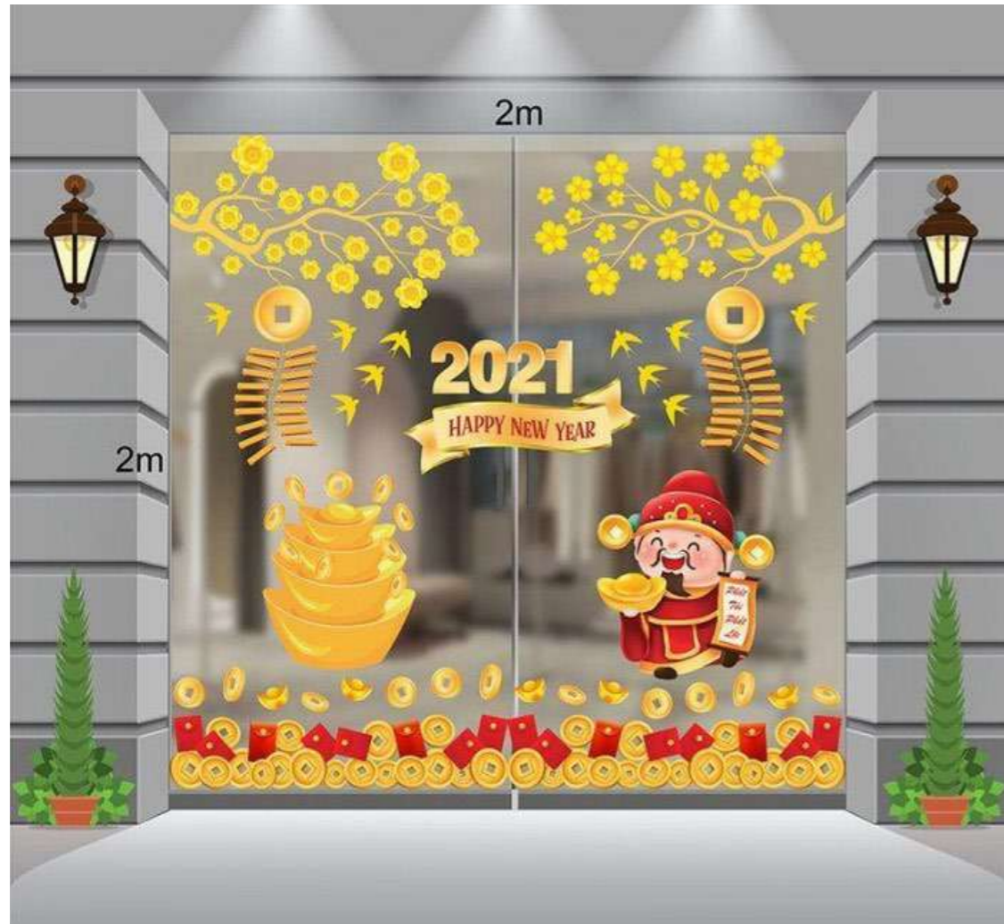
Có nhiều quan niệm cho rằng trang trí Tết đẹp sẽ giúp cho gia chủ có một năm mới sung túc, ấm no.