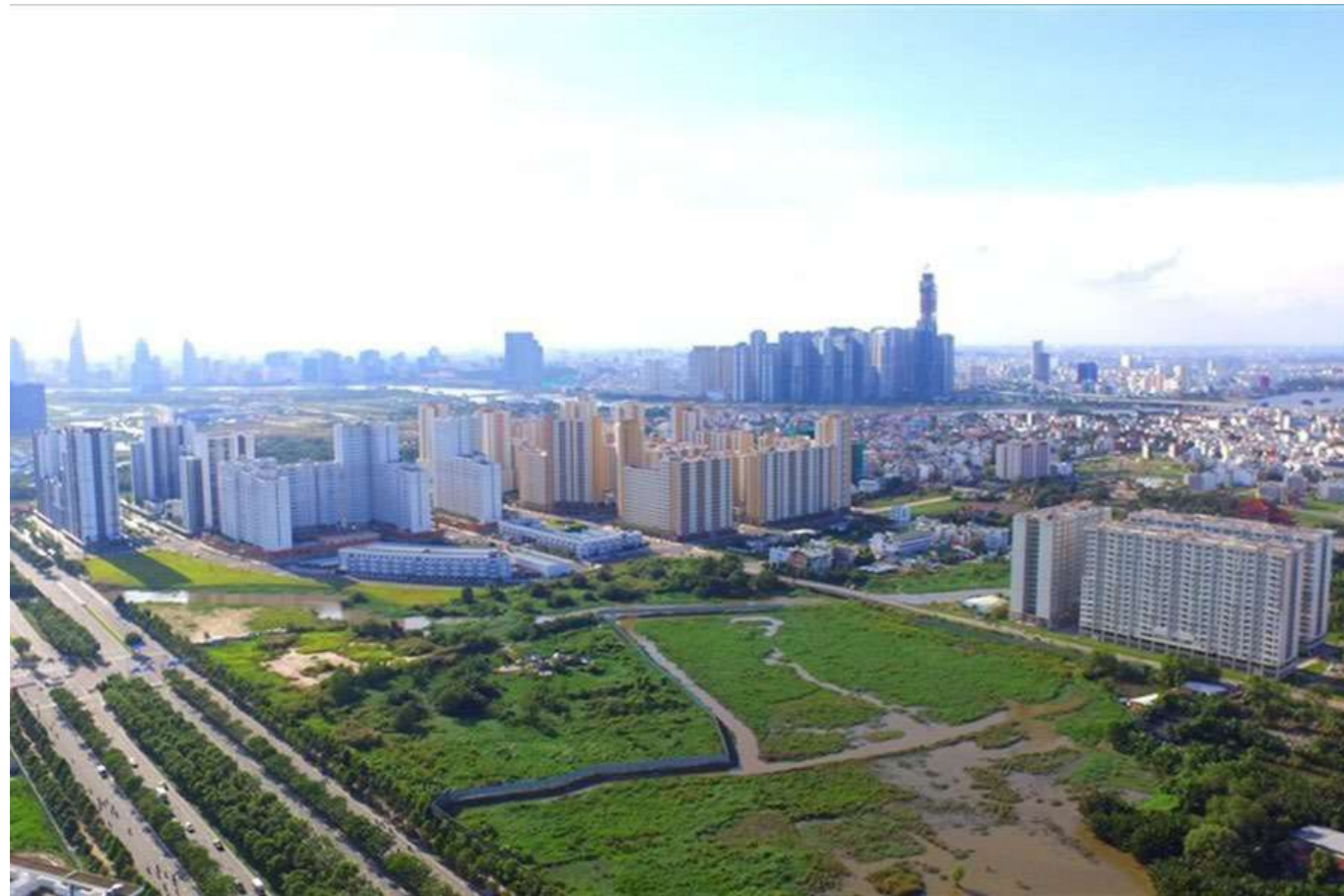
Thị trường bất động sản được dự báo sẽ nóng trở lại trong năm 2021.

Nguồn cung mới cho thị trường bất động sản sẽ tăng vọt sau khi các nút thắt pháp lý được nói lỏng. Đó là nhận định của các chuyên gia phân tích của Công ty Chứng khoán VnDirect đưa ra trong báo cáo Chiến lược đầu tư năm 2021.