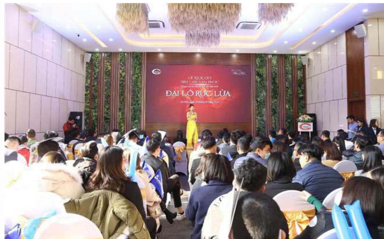
Hơn 300 chuyên viên tư vấn tham dự sự kiện kick off

Với chủ đề “Đại lộ rực lửa”, xuyên suốt sự kiện là không khí tung bừng, tràn đầy nhiệt huyết và đam mê, khơi dậy tinh thần quyết tâm của các “chiến binh” khi mong muốn thắp lửa “đại lộ” Him Lam Vạn Phúc. Dự án được kiến tạo nhằm lưu giữ và tái hiện trọn vẹn Đại lộ Champs Elysees ở thủ đô Paris hoa lệ, tạo nên một phong cách sống đẳng cấp trên chính mảnh đất Hà Nội.