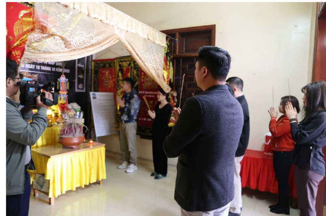
Đoàn công tác thắp hương tưởng nhớ các liệt sỹ.

Chứng kiến hoàn cảnh khó khăn của các gia đình liệt sỹ, Đoàn công tác không giấu nổi niềm xúc động trước tiếng khóc xé ruột gan, tiếng nấc nghẹn ngào không nói thành lời của những người mẹ, người vợ, người con... của các gia đình cán bộ, chiến sỹ.