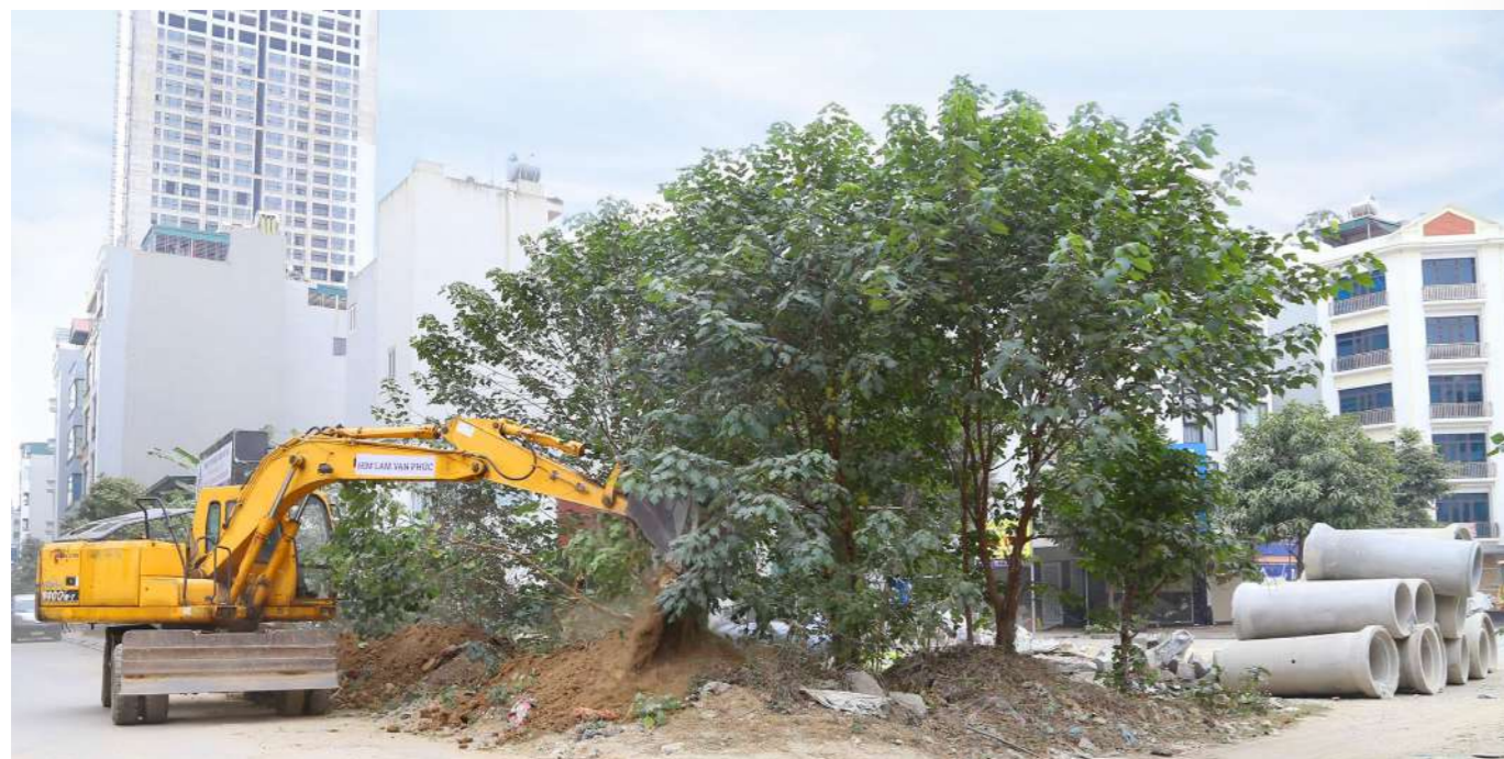
Ngay sau khi buổi lễ kết thúc các hạng mục thi công nhanh chóng được triển khai