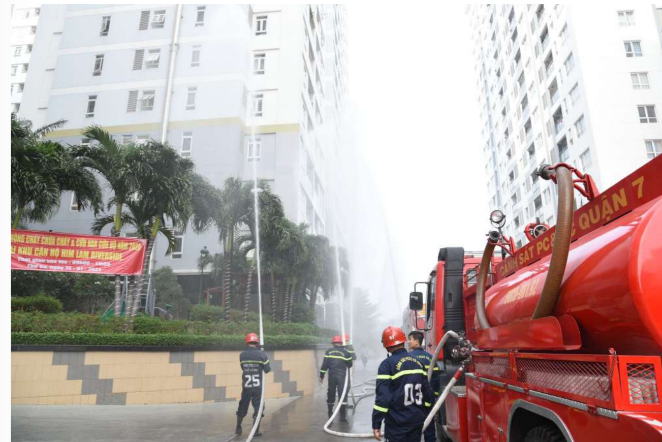
Hệ thống vòi rồng liên tục phun nước để dập tắt đám cháy giả định

Nhờ sự phối hợp nhịp nhàng giữa Ban chỉ huy và các đơn vị tham gia chương trình, buổi diễn tập thực hiện phương án phòng cháy chữa cháy, cứu hộ và cứu nạn tại Him Lam Riverside đã diễn ra thành công tốt đẹp.