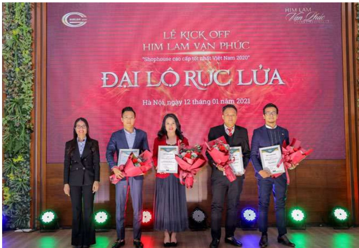
Him Lam Land đã trao chứng nhận phân phối chính thức dự án Him Lam Vạn Phúc cho các đơn vị phân phối.

Với nghi thức trao chứng nhận đã đánh dấu sự kiện hợp tác quan trọng, mở ra một trang tiếp theo trên hành trình đưa dự án Him Lam Vạn Phúc – Shophouse cao cấp tốt nhất Việt Nam 2020 do Dot Property Vietnam Awards 2020 vinh danh, đến gần hơn với khách hàng và nhà đầu tư.