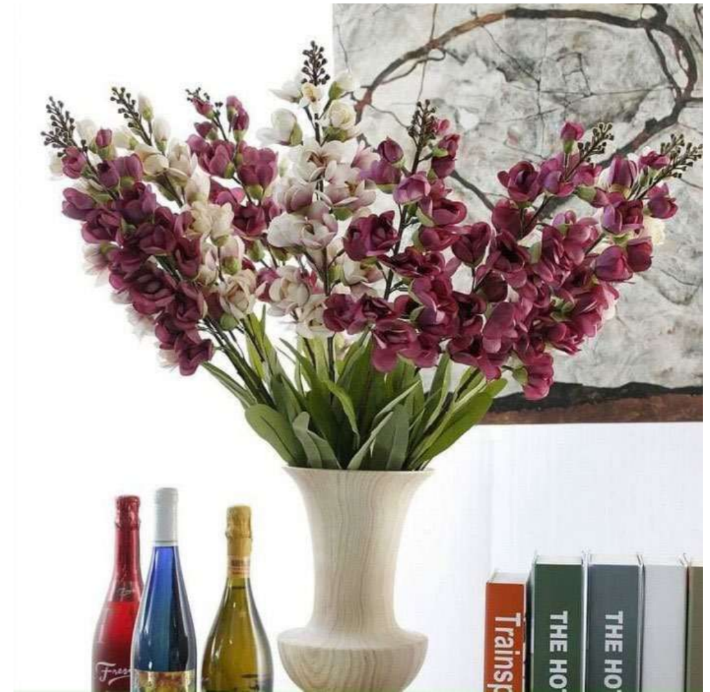
Trang trí Tết 2021 bằng hoa tươi được nhiều người ưa chuộng.

Bên cạnh đó, trang trí Tết trong nhà bằng những chậu hoa tươi cũng rất được ưa chuộng trong năm 2021. Cần lưu ý là mỗi loại hoa sẽ có ý nghĩa tượng trưng riêng, ví dụ như bạn mong muốn sự phát tài trong năm mới thì hãy chọn hoa trạng nguyên, hoa đồng tiền. Trong khi đó, hoa mai vàng lại mang đến cho mọi người cảm giác may mắn và giàu sang. Nếu không gian trong gia đình không đủ rộng, bạn có thể lựa chọn những chậu hoa nhỏ nhỏ xinh xinh đặt ở giữa bàn khách tạo sự bắt mắt và thoải mái khi khách đến chơi nhà. Nếu trang trí nhà có phòng khách lớn hoặc sân vườn, bạn nên chọn chậu hoa to để mang đến cảm giác sang trọng.