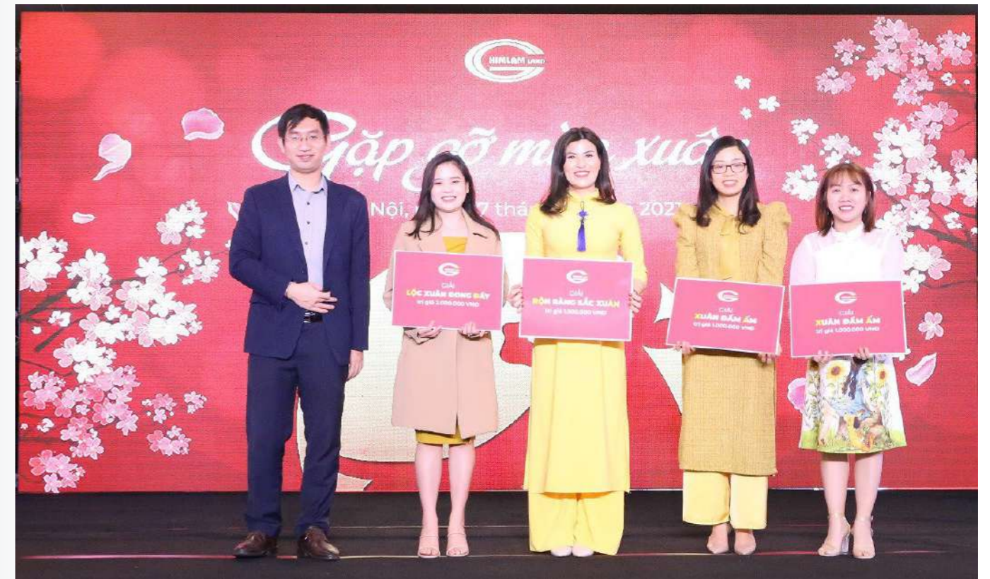
Đại diện 4 phòng ban nhận giải cuộc thi trang trí “Vui Xuân đón Tết” với chủ đề “Hương sắc ngày xuân”

Ngoài ra, tại buổi tiệc “Gặp gỡ Mùa Xuân” Ban lãnh đạo Công ty Him Lam Land đã trao thưởng cho cuộc thi trang trí “Vui Xuân đón Tết” với chủ đề “Hương sắc ngày Xuân”. Cuộc thi vừa là hoạt động chào xuân - mở đầu cho năm Tân Sửu và vừa là sân chơi cho toàn thể CBCNV Him Lam Land thỏa sức sáng tạo và ngày một đoàn kết cùng nhau.