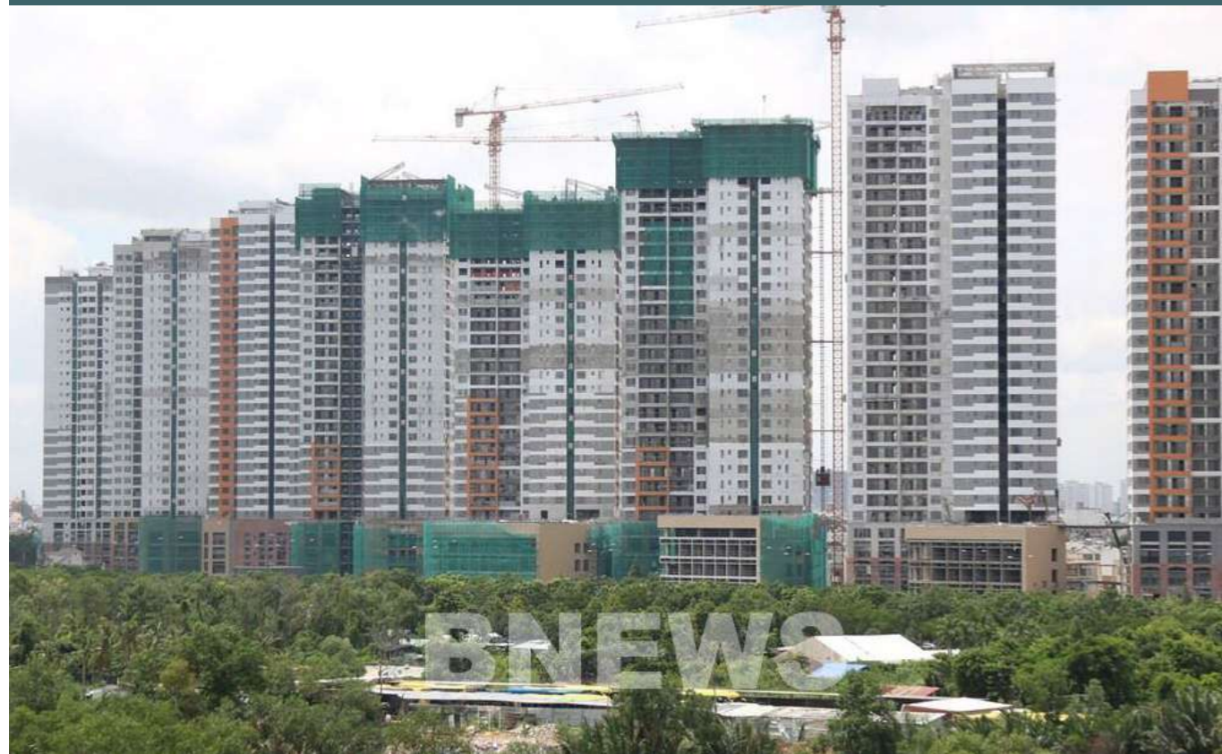
JLL đã dự báo 5 xu hướng dẫn dắt thị trường bất động sản trong năm 2021.

Các chuyên gia đến từ Tập đoàn Jones Lang LaSalle (JLL) đã dự báo 5 xu hướng dẫn dắt thị trường bất động sản trong năm 2021.