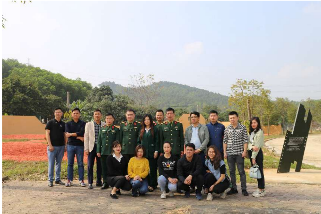
Đoàn công tác dâng hương và thăm Nhà tưởng niệm tại Khu di tích lịch sử Trương Bồn.