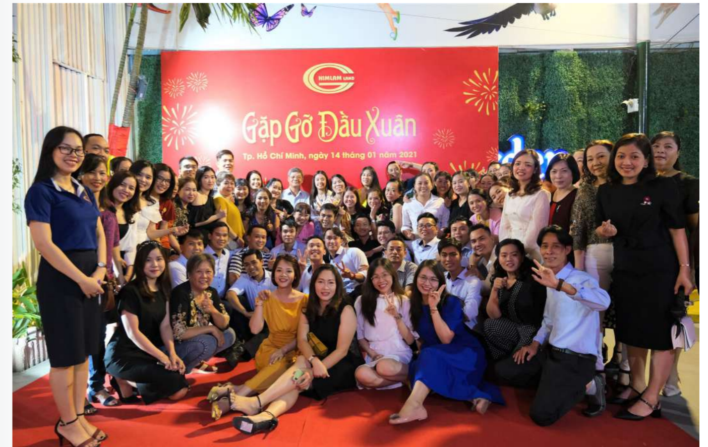
“Đại gia đình Him Lam Land” cùng nhau tề tựu trong đêm Gala Dinner “Gặp gỡ đầu xuân”.