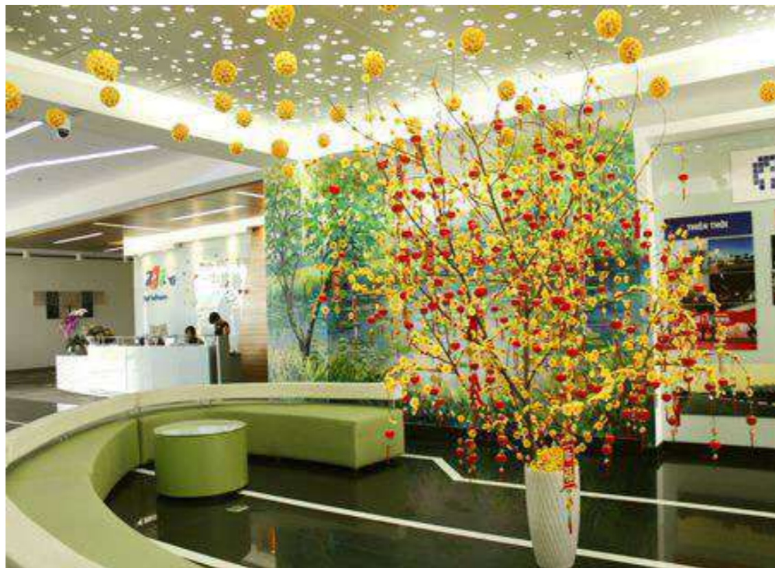
Trang trí Tết văn phòng độc đáo và ý nghĩa.