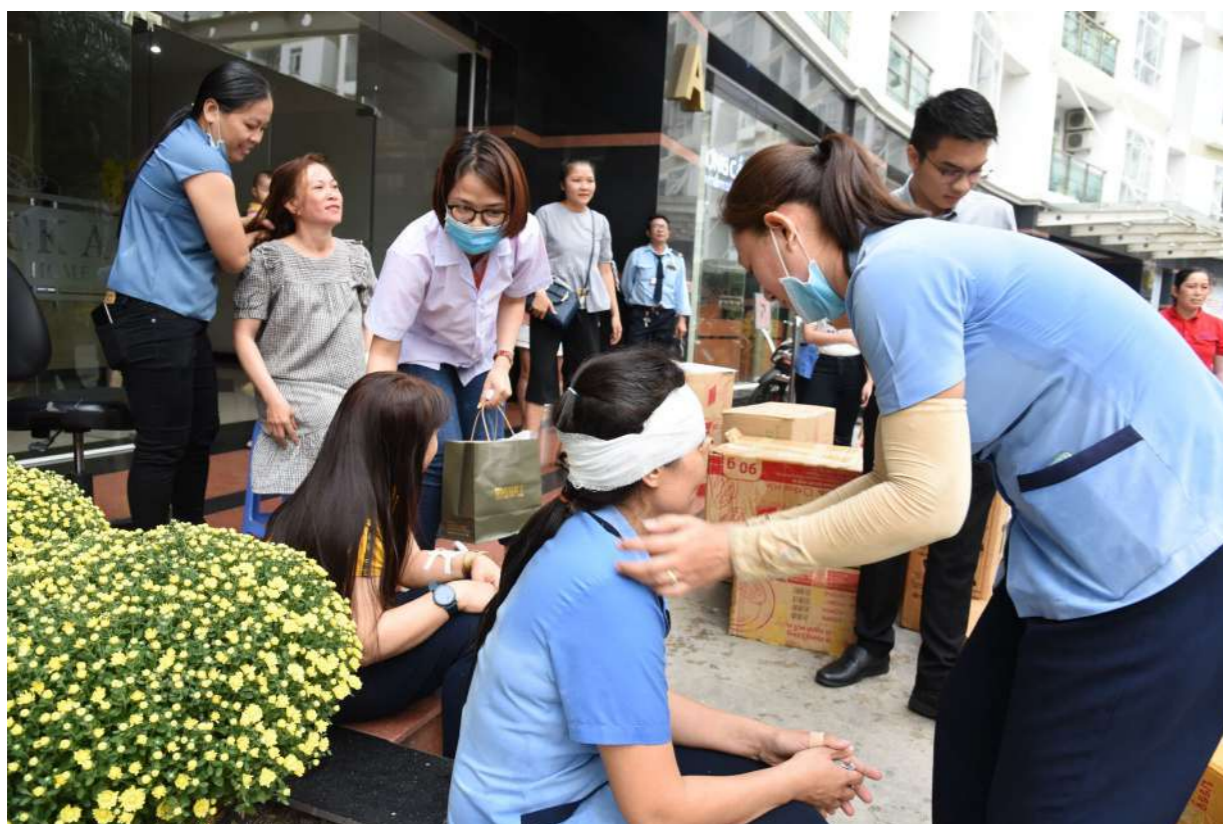
Lực lượng cứu hộ nhanh chóng di tản cư dân trong khu vực hỏa hoạn đến nơi an toàn và tiến hành các bước sơ cấp cứu

Công tác PCCC tại Him Lam Riverside nói riêng và tại các Khu căn hộ của Him Lam Land nói chung luôn được các Ban quản lý thực hiện nghiêm túc. Điều này thể hiện đúng cam kết của Him Lam Land trong việc xây dựng một môi trường sống an toàn cho cộng đồng cư dân.