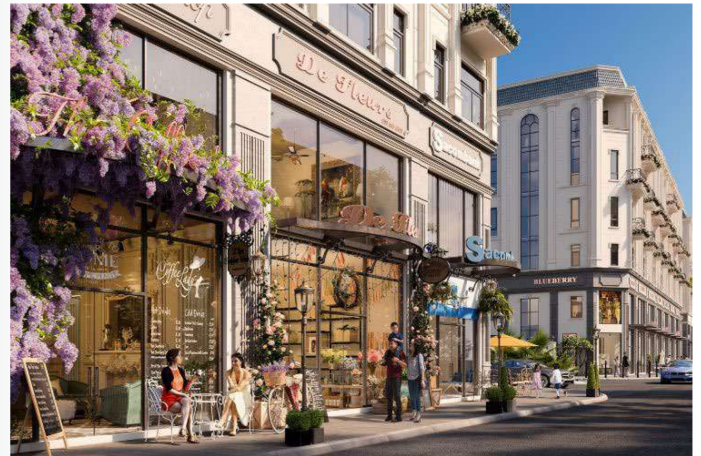
Không gian tầng 1, 2 tại Him Lam Vạn Phúc được thiết kế mở, phù hợp để kinh doanh

Theo đơn vị Phát triển – Kinh doanh dự án Him Lam Land, các sản phẩm shophouse tại Him Lam Vạn Phúc khi bàn giao đều được xây sẵn và hoàn thiện mặt ngoài; do vậy chủ nhân có thể tự điều chỉnh thiết kế và bày trí không gian phù hợp với sở thích và công năng, đồng thời vẫn đảm bảo tiêu chuẩn thiết kế, quy hoạch kiến trúc.