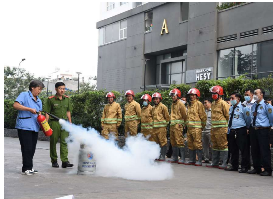
Đội chữa cháy cơ sở, nhân viên tại Khu căn hộ được hướng dẫn và thực hành các biện pháp chữa cháy

Lửa bắt đầu bùng phát tại lối ra xe ô tô, xe máy tầng hầm Block F; sau khi phát hiện cháy, đội chữa cháy cơ sở nhanh chóng tiến hành công tác cứu hỏa, đội PCCC&CNCH Quận 7 nhanh chóng có mặt ... và bắt đầu triển khai các công tác cứu hỏa, cứu hộ