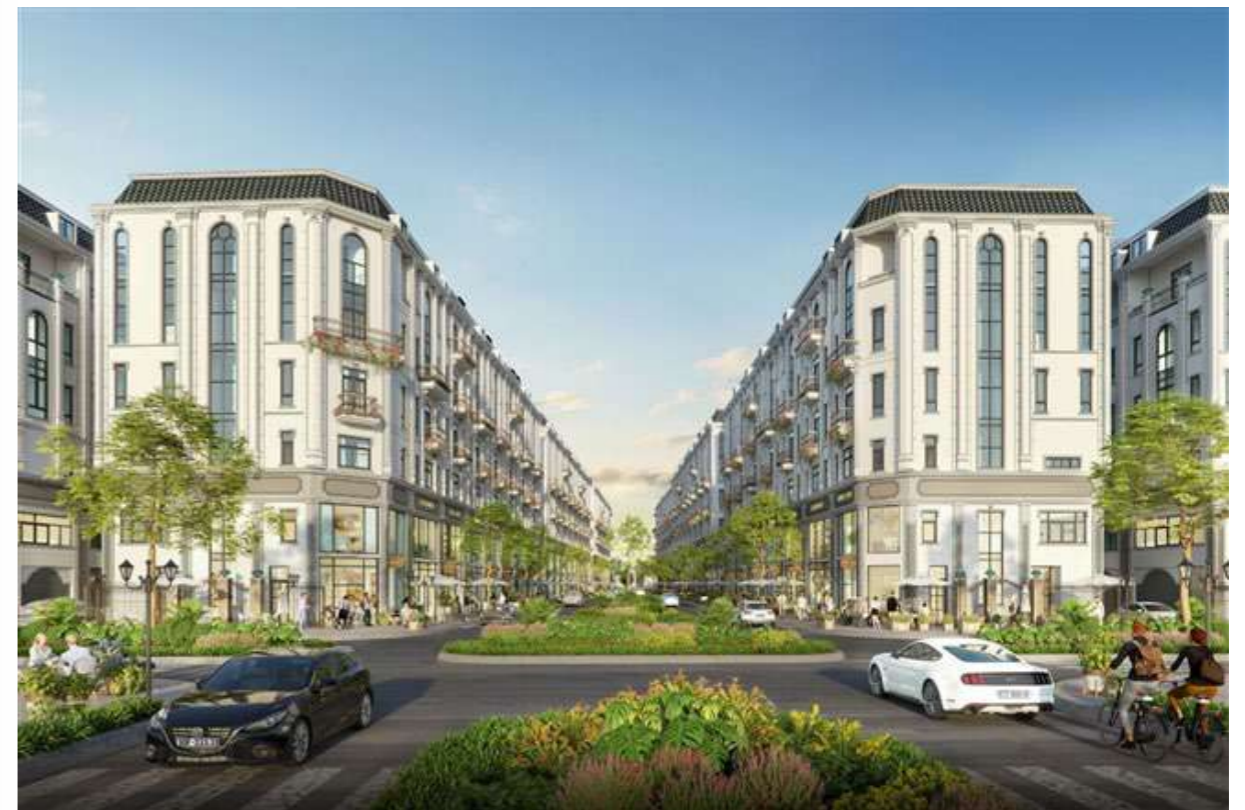
Him Lam Vạn Phúc được thiết kế 6 tầng, 2 mặt tiền, tối ưu hoạt động kinh doanh