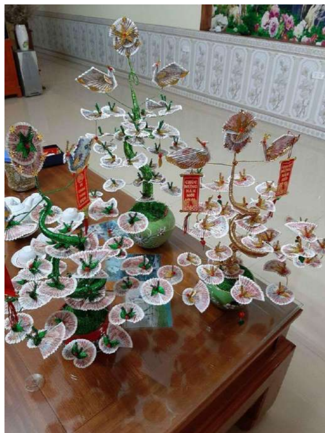
Cây tiền tài lộc trang trí Tết 2021.

Trong những năm gần đây trang trí Tết bằng cây tiền tài lộc được tự làm bằng tay được nhiều gia đình ưa chuộng. Bằng những tờ tiền có mệnh giá như 5 nghìn, 500 đồng từ sự khéo léo của bàn tay, các bạn có thể tạo ra một cây tiền lộc rất hay và độc đáo.